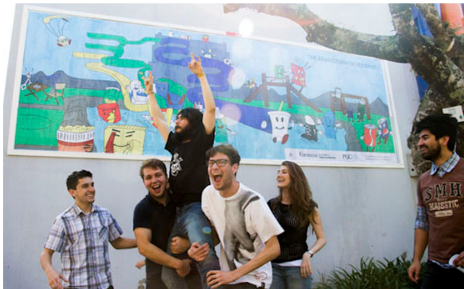
Alunos da Famecos comerando